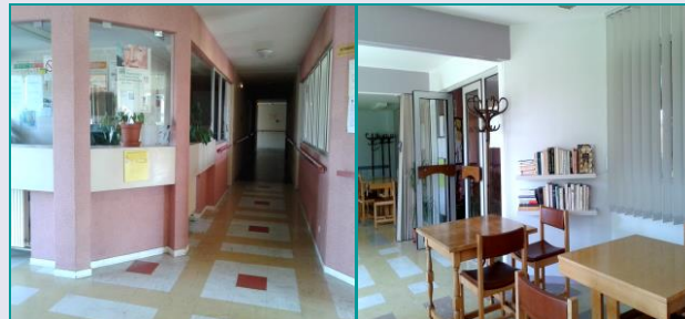
Loge du gardien

Il assure l'entretien de la résidence et veille sur votre bien-être. Pendant ses absences, une garde de nuit est assurée de 20h à 8h.